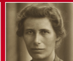
Inge Lehmann (1888-1993) Opdagede jordens kerne