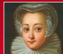
Sophie Brahe (1559-1643) "Astronomiens muse"